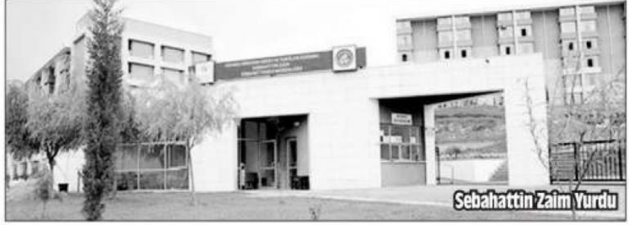
Sabahattin Zaim Yurdu

Hatay'ın İskenderun ilçesinde eğitim gören uluslararası 31 öğrenci, Kahramanmaraş merkezli depremlerin ardından Sakarya Gençlik ve Spor İl Müdürlüğüne bağlı yurtlara yerleştirildi. Hatay'da yükseköğretim hayatını sürdüren 11'i kız 31 üniversite öğrencisi, depremin ardından kente getirildi. Kız öğrenciler Sabahattin Zaim Kız Öğrenci Yurdu 'na, erkek öğrenciler ise Muhammet Fatih Safitürk Yurdu'na yerleştirildi. Ayrıca kente gelmek isteyen depremzede öğrenci ve aileler için de gerekli hazırlıkların yapıldığı öğrenildi.